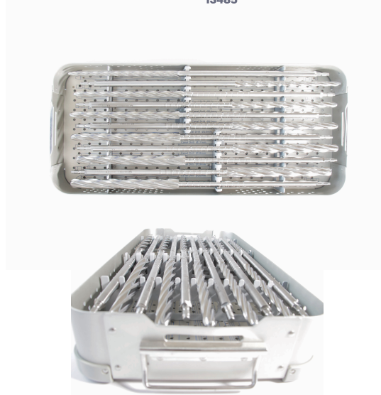
Vástago de Revisión Modular AK-MR