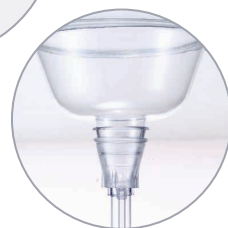
Escudo grande contra salpicaduras